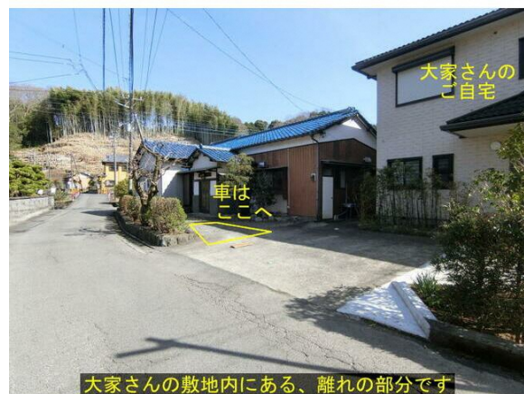
大家さんの敷地内にある、離れの部分です