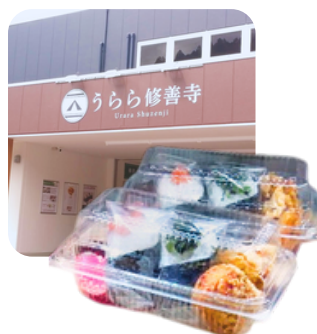
↑おむすびの具材は日替わりです

修善寺駅から徒歩3分、伊豆箱根鉄道の電車からもよく見える『修善寺ぎょうざ』と『ハレの日おむすび』を売るお店です♪ 店内の“yaneひろば”はイベントも開催される、地域に開かれた場所。 今回は、日替わりのおむすび弁当を注文します。(税込600円実費)